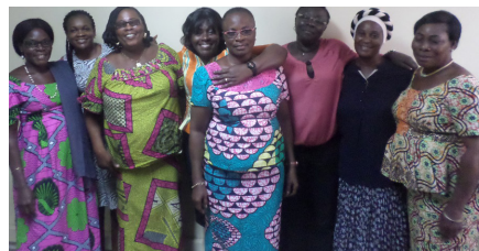
Quelques-unes des Secrétaires de Palmafrique.