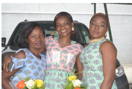
Par M. TOURE Adama, Chef de la Cellule Communication